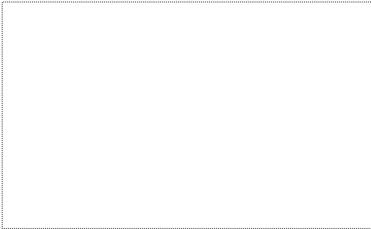
F FOTO. 1 .....